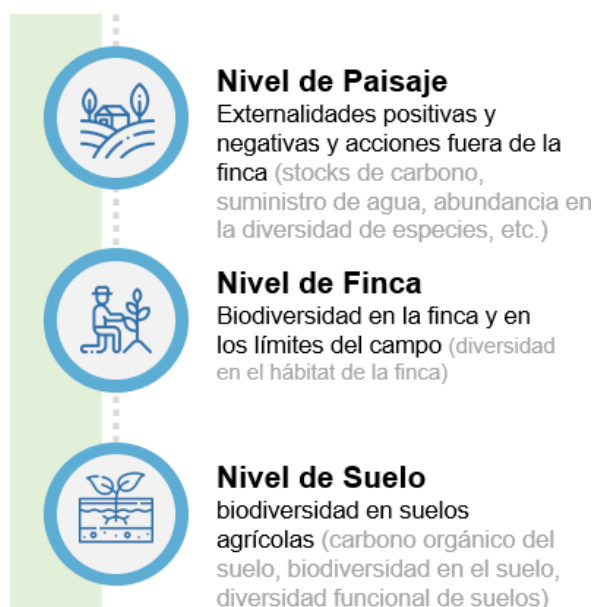
Figura 1. Niveles de análisis de la agricultura e indicadores para su medición.

Actualmente, existe una herramienta en construcción que integra indicadores y acciones para evaluarla agricultura sustentable como una Solución basada en Naturaleza 3 que serán evaluados a nivel de paisaje, finca con base en la descripción e indicadores de la figura 1. Esta consultoría se enfocará en los indicadores sociales, territoriales y políticos de la herramienta SbN de agricultura a nivel de paisaje.