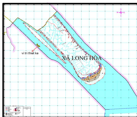
Hình 1. Vị trí trồng rừng